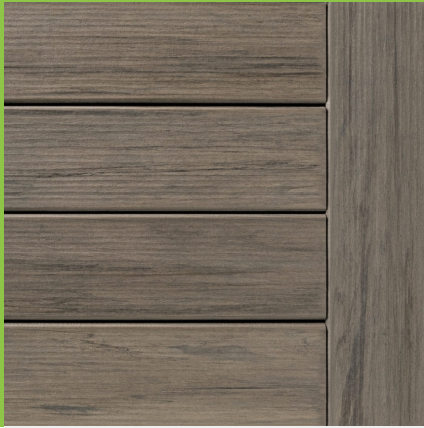
Planche de finition PLANCHES DE FINITION ASHWOOD

Fabriqué à partir de plastiques recyclés et de polymères artificiels, le bois de composite Timbertech est une excellente alternative aux terrasses de bois et présente