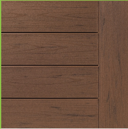
Planche de finition PLANCHES DE FINITION BROWN OAK

Pour le cadre de la terrasse ou marche d'escalier. Fabriqué à partir de plastiques recyclés et de polymères artificiels, le bois de composite Timbertech est une